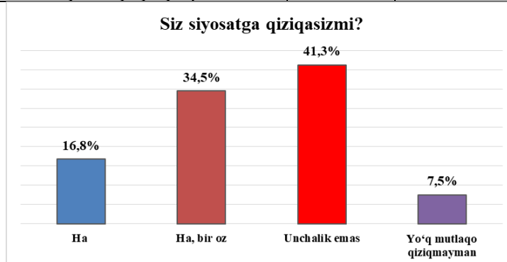
2-rasm. Siz siyosatga qiziqasizmi?

Tadqiqotimiz davomida so'rovnomaga ishtirokchilariga bir nechta savol bilan murojat qildik. Dastlab ularga siz siyosatga qiziqasizmi? savoli bilan murojaat qildik. Olingan natija esa quyidagicha bo'ldi: 16,8% ishtirokchi ha, 34,5% ishtirokchi ha, bir oz, 41,3% ishtirokchi unchalik emas va 7,5% esa yo'q mutlaqo qiziqmayman degan variantlarini belgilashgan.