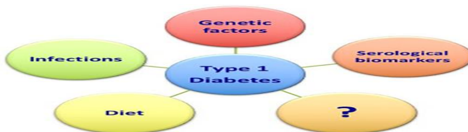
Rasm 1. 1 – tur qandli diabet bilan bog'liq asosiy prognostik havf omillari [1]

Kirish. Birinchi turdagi qandli diabet (1 – tur QD) og'ir, surunkali autoimmun kasallikdir. Ushbu kasallik periferik qondagi glyukoza metabolizmining asosiy regulyatori bo'lgan insulin sintezi va sekretiyaning buzilishi bilan tavsiflanadi. Hozirgi kunda, 1 – tur QD rivojlanishi bilan bog'liq asosiy (genetik, infeksiyon, ovqatlanish va serologik) prognostik havf omillari mavjud, biroq ushbu havf omillarini qandli diabet bo'lgan bemorning oila a'zolari o'rtasida o'tkazilgan tadqiqotlar juda kam. Bundan tashqari, davom etayotgan tadqiqotlar ushbu sohada yangi va hali noma'lum omillarning topilishi kelajakda kasallik rivojlanishini prognoz qilishga yordam beradi (1-rasm).