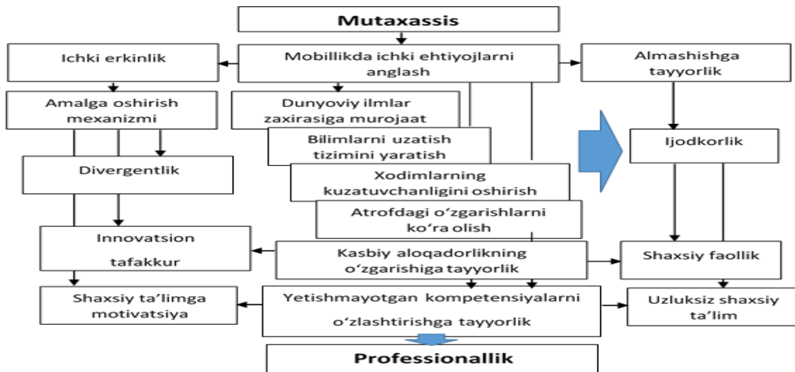
3-rasm. Kasbiy mobillik modeli

Professionalning, xususan, kasbiy mobillikning tuzilishi va mazmuniga oid barcha yondashuvlarni tahlil qilish bizga to'rt komponentga ega bo'lgan talabgor xodimning kasbiy mobilligining keng qamrovli tuzilmasini yaratishga imkon beradi. Birinchisi, yangi bilim va ko'nikmalarni egallash imkoniyati va tayyorligi; ikkinchisi – o'z kasbiy faoliyatida qayta o'zgarish qobiliyati; uchinchi – ishning yangi sharoitlariga moslashish maxorati; to'rtinchi komponent - ichki erkinlikka ega bo'lish.