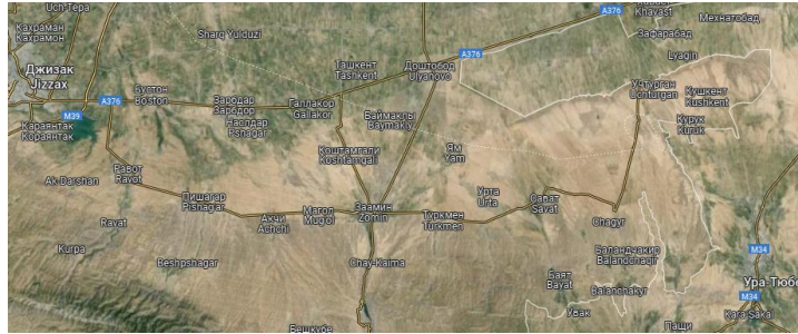
Ustrushona – Sug'd orasidagi tog' yo'llaridan biri – Pishog'ar qishlog'idan o'tgan

bo'lgan. Hozirgi kunda Jizzax viloyatining Zomin tumaniga qarashli Ravot qishlog'i yonida Pishag'ar nomli yirik aholi maskani bor. Ilk bor Ibn Havqal va Muqaddasiy asarlarida Bishog'ar nomi ostida Ustrushonaga qarashli rustoqlardan biri sifatida tilga olinib, tadqiqotchilar bu toponimni sug'diy til negizida Pishag'ar “tog' oldi”, “tog' etagi” degan so'z bilan bog'laydilar[7]. Sug'diy tilda “pesh”, “pish” so'zi “old”, “g'ar” esa “tog'” degan ma'noni bildirishi, qadimgi ustrushonalik aholining ko'pchiligi tili sug'diy tilda so'zlashganidan kelib chiqilsa, bu izoh o'z tasdig'ini topadi.