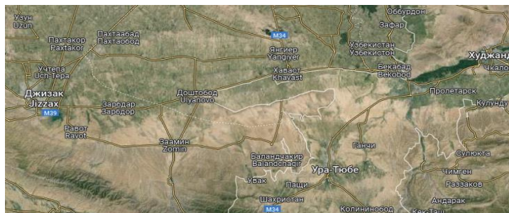
Tarixiy Ustrushonaning yirik shaharlari – Jizzax, Zomin, O'rtepa

yoki “pesh” topoformanti bilan yasilib, “old”, “oldingi tomon” ma'nosidagi eroniy tillarga xos bu so'z bilan bog'liq ko'plab toponimlar tarixiy yozma manbalarda ko'plab uchraganidek, bugungi kun O'rta Osiyo toponimiyasida ham yaxshi saqlanib qolgan. Ayniqsa, tarixiy Sug'd va Ustrushona vohalarida bir xil toponimlarning uchrashi o'z tarixiy asoslariga ega.