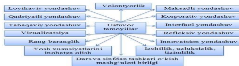
1-rasm. Boshlang'ich sinf o'quvchilarida oilada kitobxonlikni targ'ib qilishning ustuvor bo'lgan tamoyillari

Har qanday faoliyat, jarayon va tizimning g'oyasi, amaliy qiymati uning qanday tamoyillarga tayanganligiga bog'liq bo'ladi. SHu sababli faoliyatni tashkil etishni rejalashtirish, jarayonning kechishini ta'minlash va tizimni shakllantirishda uning mohiyatida yetakchi o'rin tutuvchi ustuvor tamoyillar belgilab olinadi. Zero, tamoyillar ularning tadrijiy yo'nalishini belgilab beradi, shuningdek, tartib, qoida tusini oladi. Shu bois tadqiqotni olib borish davrida boshlang'ich sinf o'quvchilarida oilada kitobxonlikni targ'ib qilishning asosiy omillarini rivojlantirishga qaratilgan pedagogik jarayon samaradorligini ta'minlashda ustuvor bo'lgan tamoyillarni aniqlashga alohida e'tibor qaratildi. Tadqiqot muammosiga oid ilmiy ishlarni nazariy tahlil qilish, pedagogik amaliyotni kuzatish, tajriba-sinov ishlariga jalb etilgan respondent-o'quvchilar, metodist o'qituvchilarning jarayonga bo'lgan munosabatlarini tahlil qilish orqali boshlang'ich sinf o'quvchilarida oilada kitobxonlikni targ'ib qilishning asosiy omillarini rivojlantirishda quyidagi tamoyillar ustuvor ahamiyatga egaligiga ishonch hosil qilindi (1-rasm):