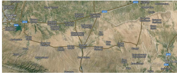
Ustrushona – Sug'd orasidagi tog' yo'llaridan biri – Pishog'ar qishlog'idan o'tgan

bo'lgan. Hozirgi kunda Jizzax viloyatining Zomin tumaniga qarashli Ravot qishlog'i yonida Pishag'ar nomli yirik aholi maskani bor. Ilk bor Ibn Havqal va Muqaddasiy asarlarida Bishog'ar nomi ostida Ustrushonaga qarashli rustoqlardan biri sifatida tilga olinib, tadqiqotchilar bu toponimni sug'diy til negizida Pishag'ar “tog' oldi”, “tog' etagi” degan so'z bilan bog'laydilar[7]. Sug'diy tilda “pesh”, “pish” so'zi “old”, “g'ar” esa “tog'” degan ma'noni bildirishi, qadimgi ustrushonalik aholining ko'pchiligi tili sug'diy tilda so'zlashganidan kelib chiqilsa, bu izoh o'z tasdig'ini topadi.